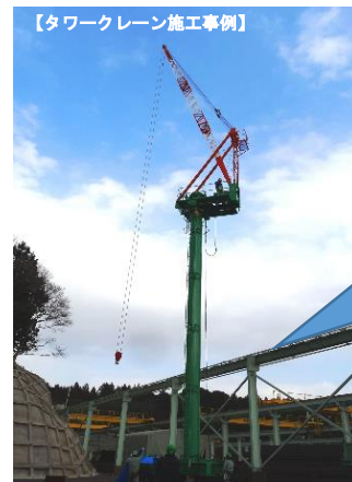
【タワークレーン施工事例】