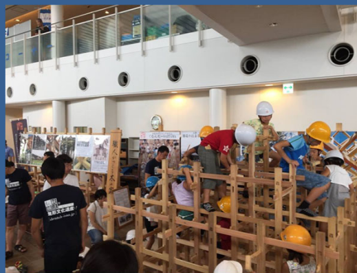
【子供達による木構造ジャングルジム製作体験】