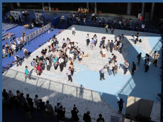
【プロジェクションマッピング学習】