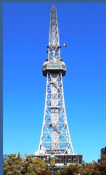
【名古屋テレビ塔免震改修工事 見学ツアー】